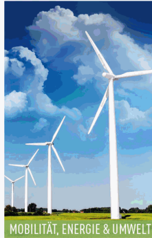
MOBILITÄT, ENERGIE &amp; UMWELT