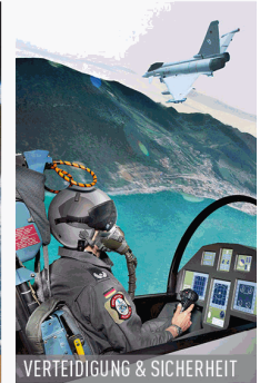
VERTEIDIGUNG &amp; SICHERHEIT

Wir sind eine eng vernetzte Unternehmensgruppe und bieten integrierte zukunftsorientierte Lösungen in den Branchen Automotive • InfoKom • Mobilität, Energie & Umwelt • Luftfahrt • Raumfahrt • Verteidigung & Sicherheit. Wir verstehen die Anforderungen unserer Kunden. Wir beraten unabhängig und kompetent. Wir realisieren effektiv, effizient und zielgerichtet. Wir betreiben zuverlässig und nachhaltig. Unsere internationale Marktpräsenz und unser Erfolg basieren auf technologischer Spitzenkompetenz und einem fairen Verhältnis zu unseren Kunden und Geschäftspartnern.